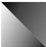
iron grey satinato